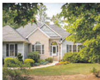
Ein Traumhaus, mitten im Grünen

Dietmar Spieß · Wilhelmstraße 49 · 99834 Gerstungen