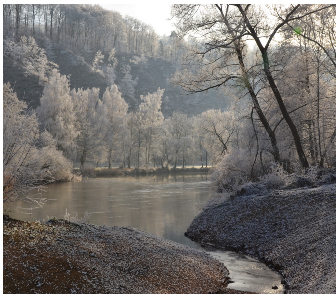
Werraue bei Frankenroda