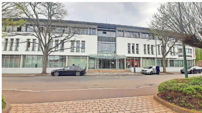
Das Landratsamt in Eisenach

EISENACH. Im neuen Landratsamt des Wartburgkreises an der Rennbahn in Eisenach fand am Montag, 3. Januar der erste gemeinsame Arbeitstag statt. Nachdem Eisenach bereits Mitte des letzten Jahres juristisch in den Wartburgkreis zugekehrt ist, hat der Landkreis nun mit Beginn des Jahres auch praktisch Verwaltungsaufgaben von der Stadt übernommen.