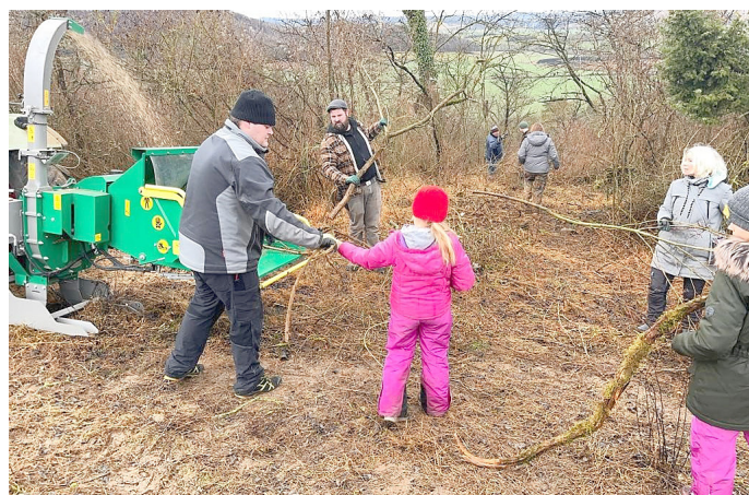
Mitglieder des Creuzburger Ziegenvereins beim Freistellen eines Triftweges

CREUZBURG. Zwischen Weihnachten und Neujahr trafen sich Mitglieder des Landschaftspflegevereins Creuzburger Ziegen e.V., des BUND Kreisverbandes Wartburgkreis und des Landschaftspflegeverbandes Eichsfeld-Hainich-Werratal e.V. um gemeinsam dafür zu sorgen, dass die neu erschlossenen Beweidungsflächen bei Creuzburg Richtung Muhlberg auch gut für die Ziegen und Schafe erreichbar werden.